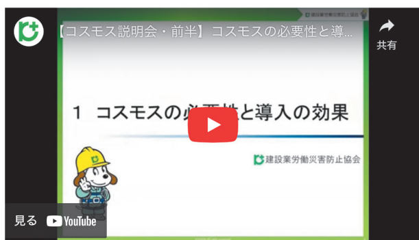
1 コスモスの必要性と導入の効果 2 「コスモス」について -コスモスガイドラインのポイント-