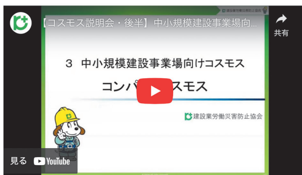
3 中小規模建設事業場向けコスモス「コンパクトコスモス」について